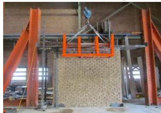
c) Overall view of the wall