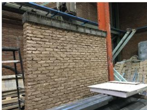
Fig. 5. The wall specimen and the top RC beam

همچنین، با استفاده از دو نبشی قائم که در موقعیت پاشنه دیوار و از پائین تا بالا و در دو وجه پشتی و جلویی دیوار قرار گرفته بود، از بروز بلندشدگی (Uplift) به دلیل اعمال بار جانبی