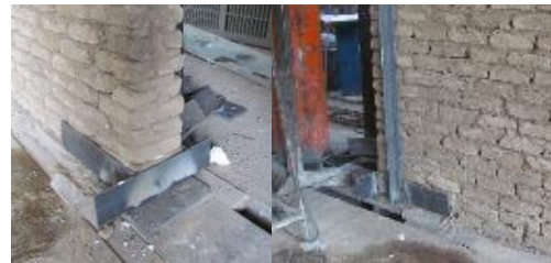
a) Controlling slip at heel and toe

ب) جزئیات مهار دیوار برای جلوگیری از وقوع بلندشدگی