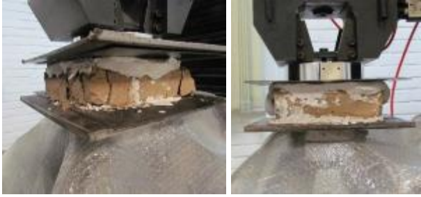
Fig. 5. Compressive strength test on adobe sample