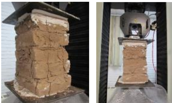
Fig. 6. Compressive strength test on adobe prism

به منظور برآورد دقیق مقدار مقاومت برشی، انجام آزمون مقاومت برشی قطری توصیه می شود؛ اگرچه انجام این