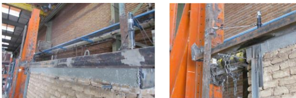
Fig. 10. Adopted instruments for measuring displacement