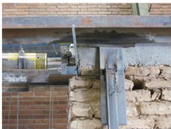
Fig. 13. Initiation of diagonal cracking