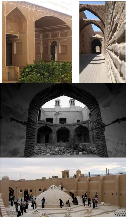
Fig 2. Examples of walls, backings and vaults in historic districts of Yazd [2]

از دیگر مولفه‌های معماری که بر فرم سازه و مهار جانبی دیوارها تاثیرگذار است، تنوع موجود در انتخاب طاقها و گنبد‌های مناسب برای بنا با توجه به نقشه معماری می‌باشد. با توجه به مشاهدات میدانی شکل (۲)، تبحر استادکاران و معماران سنتی در اجرای انواع سقف‌های قوسی به شیوه‌های متنوع و با بهره‌گیری از المان‌های مختلف، امکان اجرای