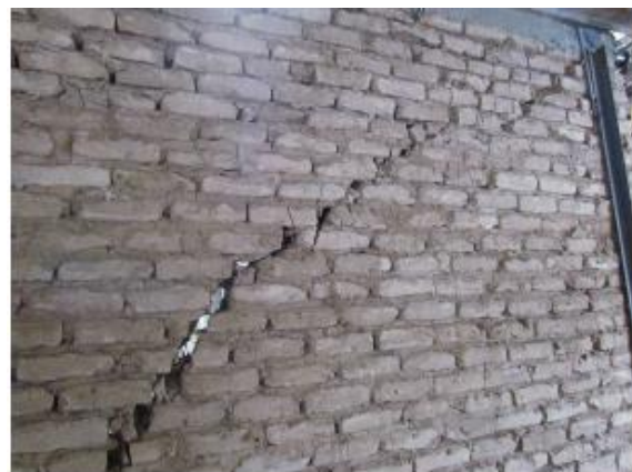
b) Crack opening - back view