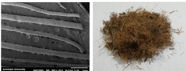
Fig.3. Palm fibers and their microscopic picture [7]

برای این الیاف، قطری بین ۰/۱ تا ۱ میلی متر، طولی بین ۵ تا ۶۰ میلی متر، میانگین مقاومت کششی ۸۶ مگاپاسکال، میانگین کرنش گسیختگی ۰/۱۰۹ و میانگین مدول الاستیسیته ۲۳۸۲ مگاپاسکال گزارش شده است [7]. با بررسی نمونه های مکعبی با ابعاد ۵ × ۵ × ۵ سانتی متر برای آزمایش مقاومت فشاری، اسلامی و همکاران وجود الیاف را بر افزایش شکل پذیری به ویژه در ناحیه افت مقاومت فشاری موثر دانسته و بیشترین شکل پذیری را برای نمونه های مسلح شده با الیاف با درصد وزنی ۰/۵ و ۰/۷۵ درصد گزارش کرده اند. تغییر در مقدار مقاومت فشاری نیز مانند شکل پذیری در تناسب با تغییر مقدار وزنی الیاف خرما مشاهده نشده است. به شکلی که در شرایطی که کمترین مقاومت فشاری نمونه شاهد حدود ۳/۳۶