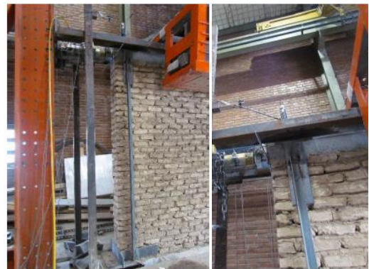
b) Adopted details for controlling the uplift in the wall

ب) جزئیات مهار دیوار برای جلوگیری از وقوع بلندشدگی