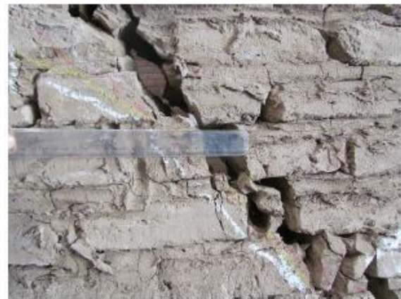
a) Crack opening - front view