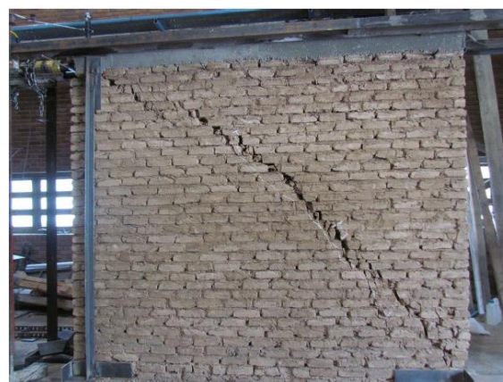
a) Front view of the cracking in the wall