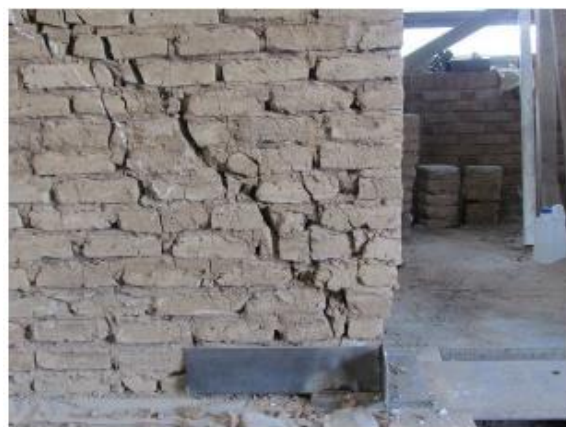
Fig. 14. Tow crushing

بدون افت ناگهانی یا خرابی موضعی شدید تجربه می‌کند. در این مسیر، مقاومت دیوار به تدریج کاهش می‌یابد و در تغییر مکان ۶ سانتی متر به حدود نصف ظرفیت تجربه شده می‌رسد. با توجه به نگرانی‌های مربوط به خرابی موضعی دیوار، بارگذاری در این تغییر مکان متوقف شده است.