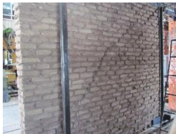
b) Back view of the cracking in the wall Fig. 12. Overall view of the wall at the end of the test