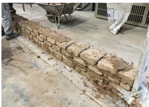
Fig. 7. Adopted details for controlling slip at wall's footage

پس از اجرای کامل دیوار و سپری شدن مدت زمان خشک شدن دیوار، در موقعیت قرارگیری جک اعمال کننده بار جانبی یک تیر بتن آرمه با ابعاد 20 \times 20 سانتی متر و مسلح شده با میلگردهای طولی 4 \Phi 10 و خاموت های \Phi 8 در فواصل ۱۵ سانتی متر در کل طول دیوار اجرا شد (شکل ۸). برای مهار این تیر در دیوار، از شاخک‌هایی از جنس میلگرد استفاده شد که در رج‌های انتهایی دیوار مهار شد.