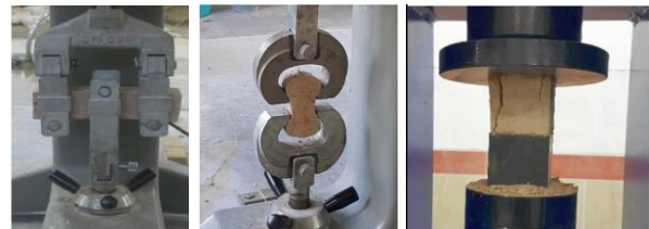
Fig. 4. Set-up for compressive, tensile and flexural strength tests of clay mortar